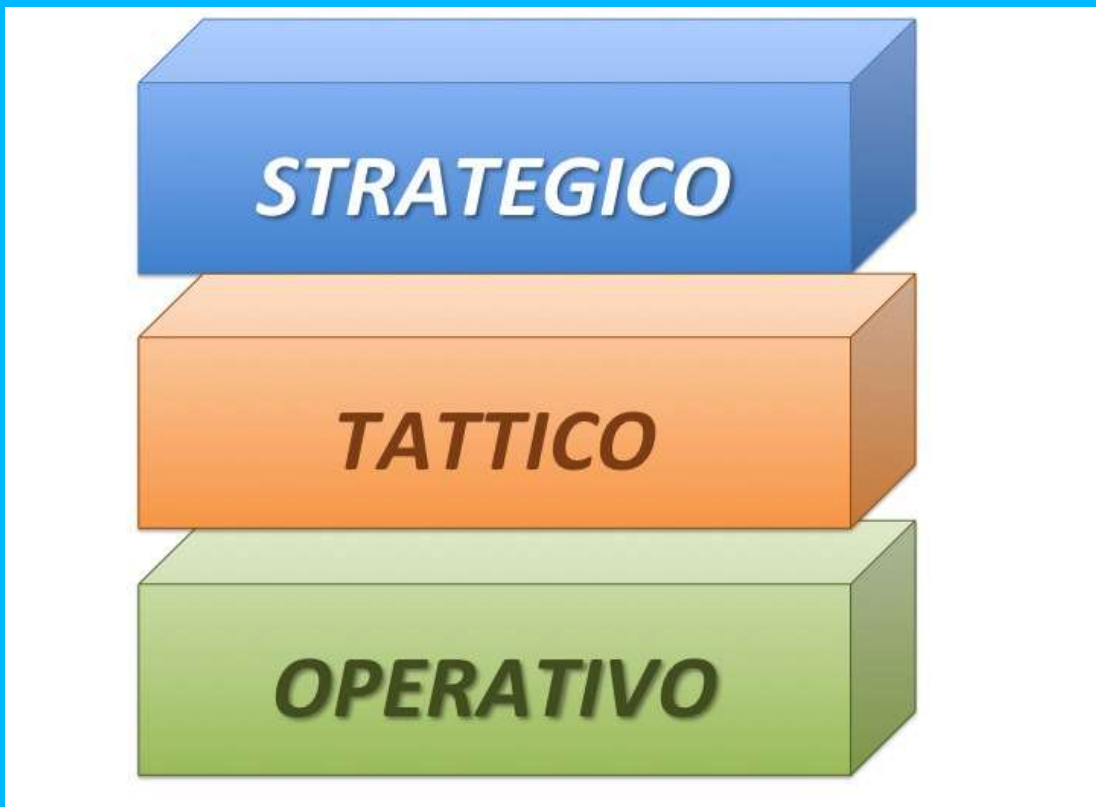
FIGURA DEI PIANI DECISIONALI